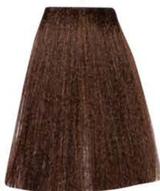
BIONDO SCURO DORATO