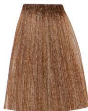
BIONDO CHIARO DORATO