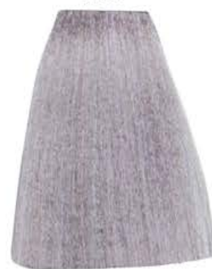
BIONDO PLATINO IRISÉ