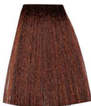
CASTANO CHIARO RAME