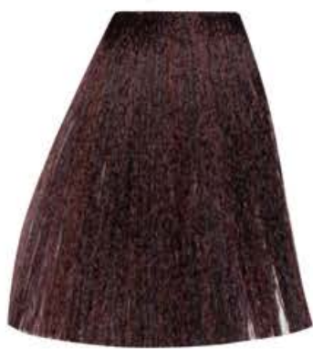
CASTANO CHIARO ROSSO INTENSO