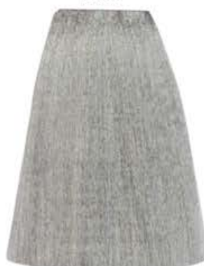
BIONDO CENERE PLATINO