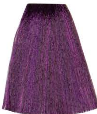
BIONDO VIOLA INTENSO