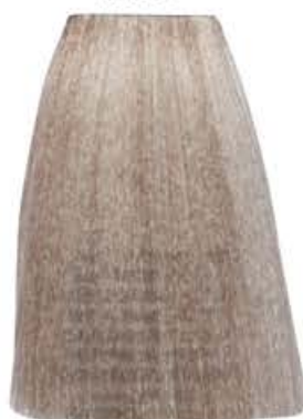
BIONDO NATURALE PLATINO