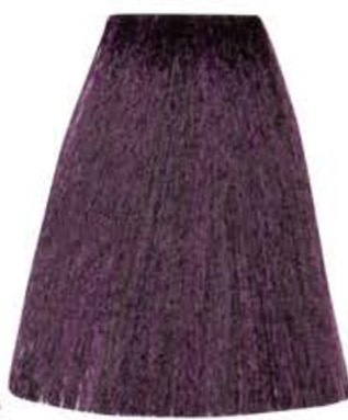
BIONDO SCURO VIOLA INTENSO