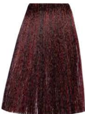
BIONDO SCURO ROSSO INTENSO