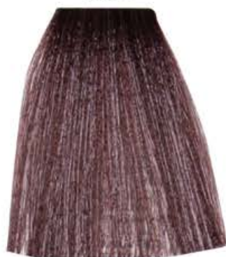
BIONDO CENERE IRISÉ