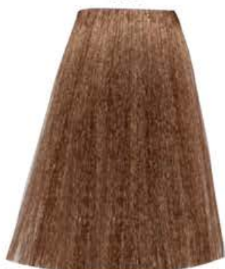
BIONDO CHIARISSIMO DORATO