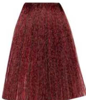
BIONDO ROSSO INTENSO