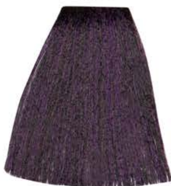
CASTANO CHIARO VIOLA INTENSO