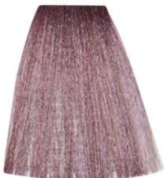
BIONDO CHIARISSIMO CENERE IRISÉ