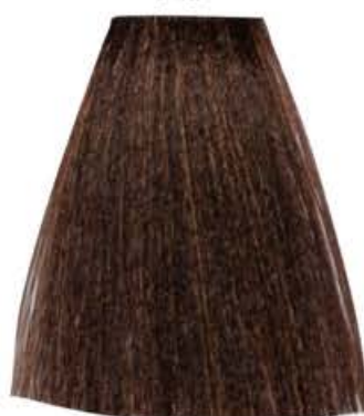
CASTANO CHIARO DORATO