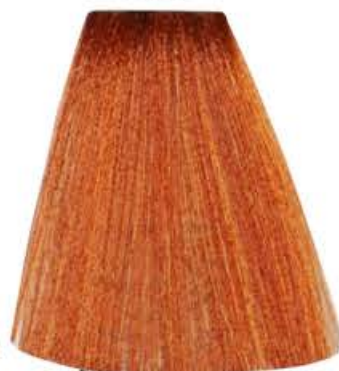
BIONDO CHIARO RAME