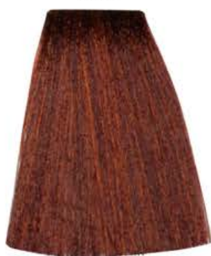
BIONDO SCURO RAME